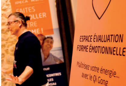
Atelier Qi Gong